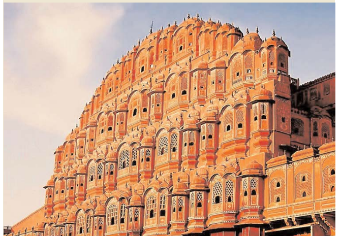
HAWA MAHAL - JAIPUR

de la Ciudad, situado en el corazón del casco antiguo con una mezcla de arquitecturas Rajastán y mogol; el ex maharaja todavía reside en el Chandra Mahal uno de los edificios, una parte actualmente es un Museo, posee una extensa colección