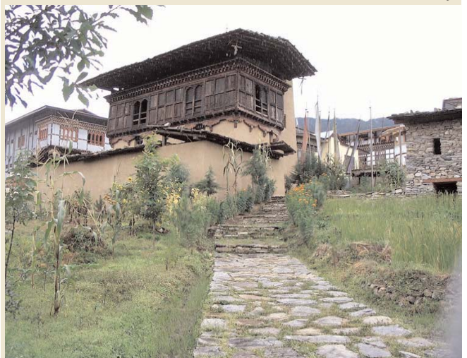
FOLK HERITAGE MUSEUM - THIMPU

Día 07 Gangtok. Pensión completa. Visita del Monasterio de Rumtek al otro lado del valle; del Monasterio de Enchey