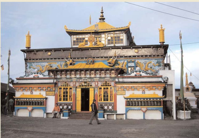
GHOOM MONASTERY - DARJEELING

Día 03 Kolkata / Bagdora / Darjeeling (avión+coche-96